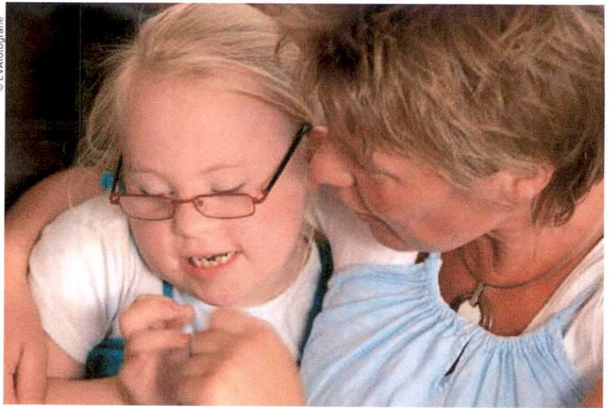
Dans le cadre du mandat de protection future pour autrui, ce sont les parents, ou le survivant d'entre eux, qui désignent le mandataire de leur enfant.

La mise en œuvre du mandat. Le mandat a vocation à prendre effet le jour où le ou les parents de l'enfant en situation de handicap ne peuvent plus s'en occuper, du fait soit d'une altération de leurs propres facultés, soit de leur décès.